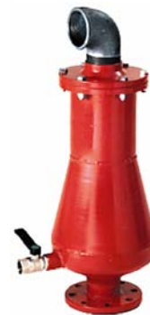
Légszelepek DN15 – 200 vízre és szennyvízre is