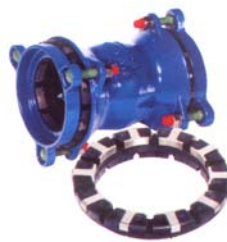
Orion csőkötések DN50 – 300 húzásbiztos kötéssel is