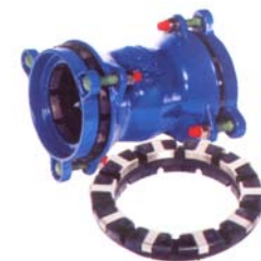
Orion csőkötések DN50 – 300 húzásbiztos kötéssel is