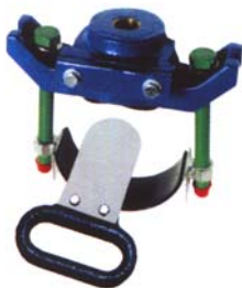
Megfűrők DN80 – 300 nyomás alatti kivitelben is

Precíz kivitelezés + csúcsminőségű szerelvények = problémamentes hálózat