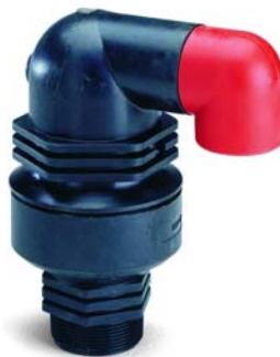
Légszelepek DN15 – 200 ivóvízre és szennyvízre is